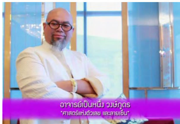
อาจารย์เป็นหนึ่ง วงษ์ภูด "ศาสตร์แห่งตัวเลข และลายเซ็น"

21.30 น. ร่วม พิธี ขอพร ไหว้พระแม่คงคา มหาสมุทร กับ ชินแสเป็นหนึ่ง วงษ์ภูด เพื่อเสริม ความเป็นศิริมงคล กับชีวิต เสริมดวงชะตา เรื่องการงาน การเงิน และครอบครัว ปรับเปลี่ยนโยกย้ายดวงดาว ให้ชีวิตดียิ่งขึ้น